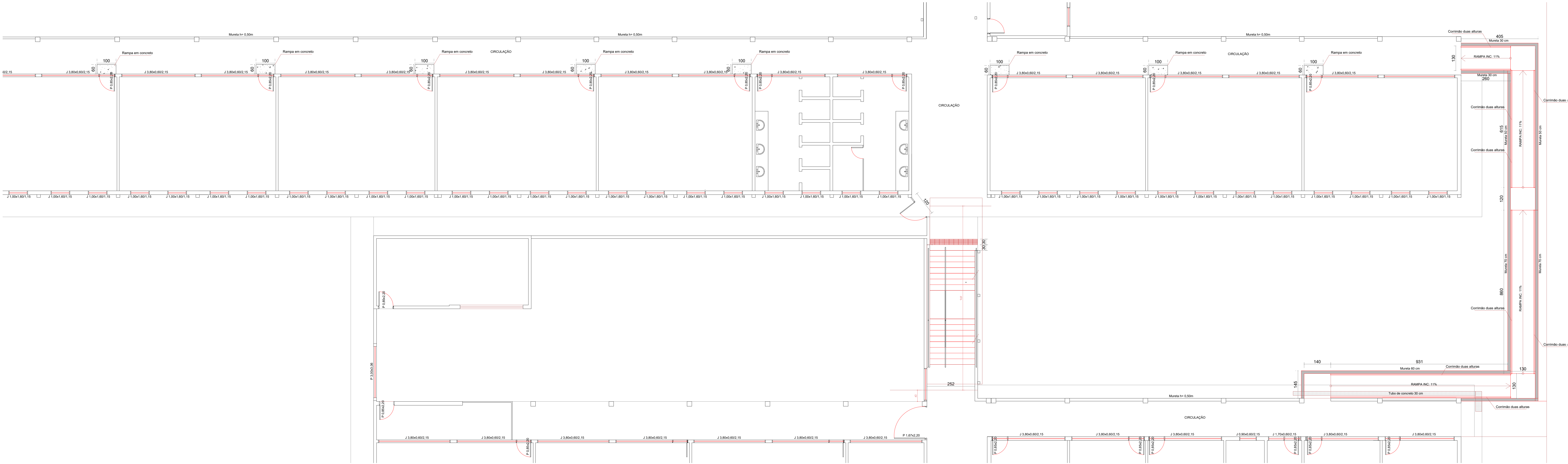
PLANTA BAIXA - RAMPA E REFORMAS ESCALA 1:75