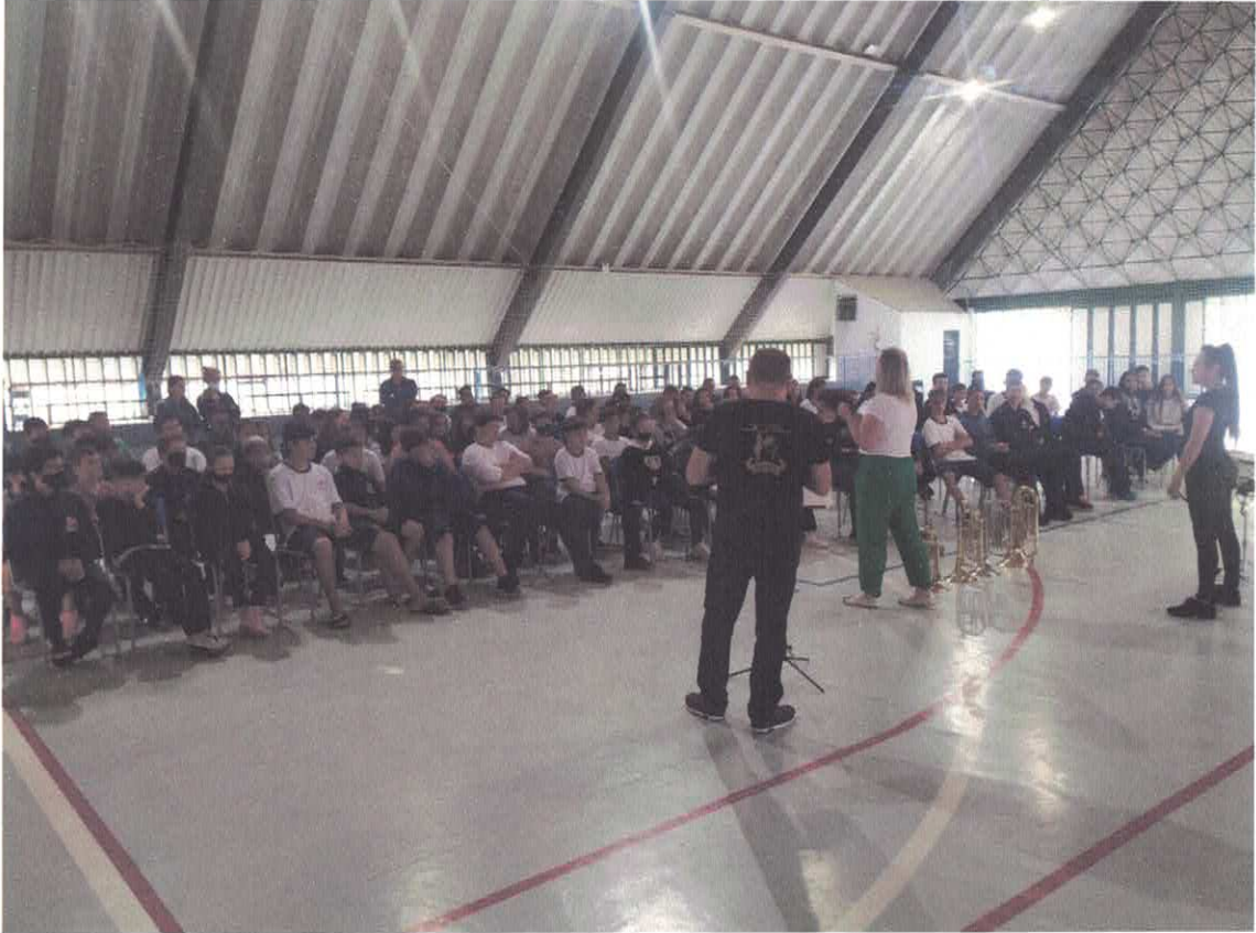
Palestra musical na Escola JOÃO XXIII – Projeto Bandas e Fanfarras Unidas pela Música