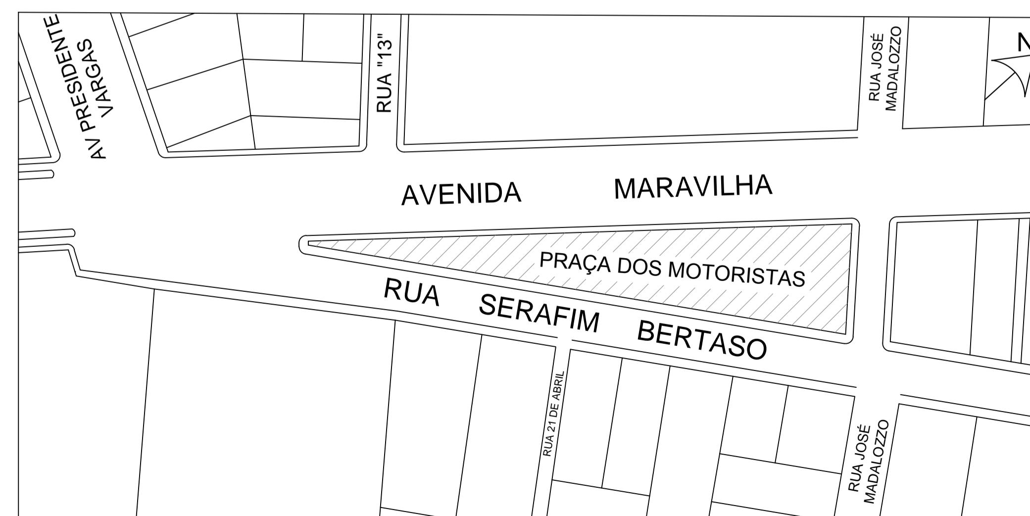
SITUAÇÃO ESCALA 1:1000