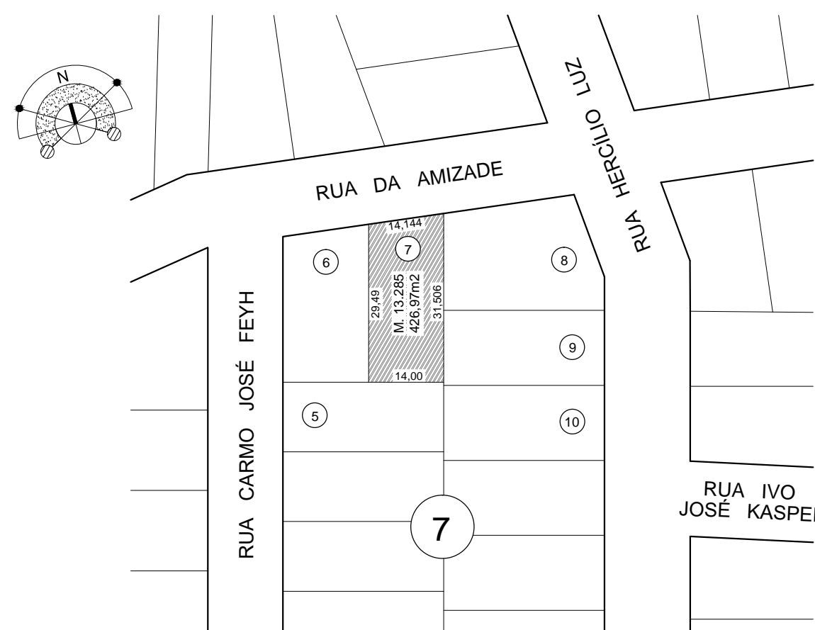
PLANTA DE SITUAÇÃO ESC.: 1: 1000