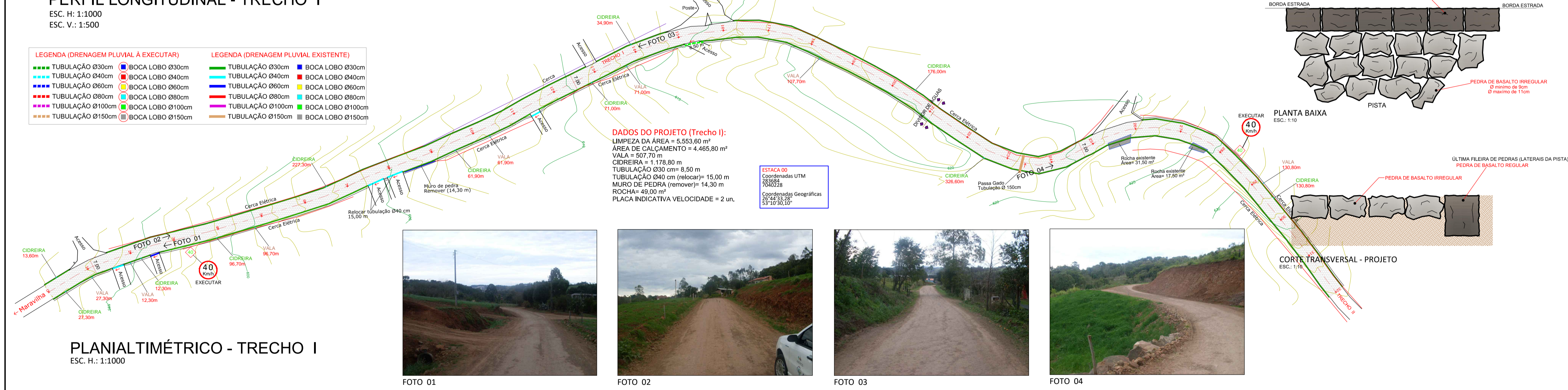
PLANIALTIMÉTRICO - TRECHO I ESC. H.: 1:1000

ESTACAO Coordenadas UTM 7080376 5347301 22 S 48 W