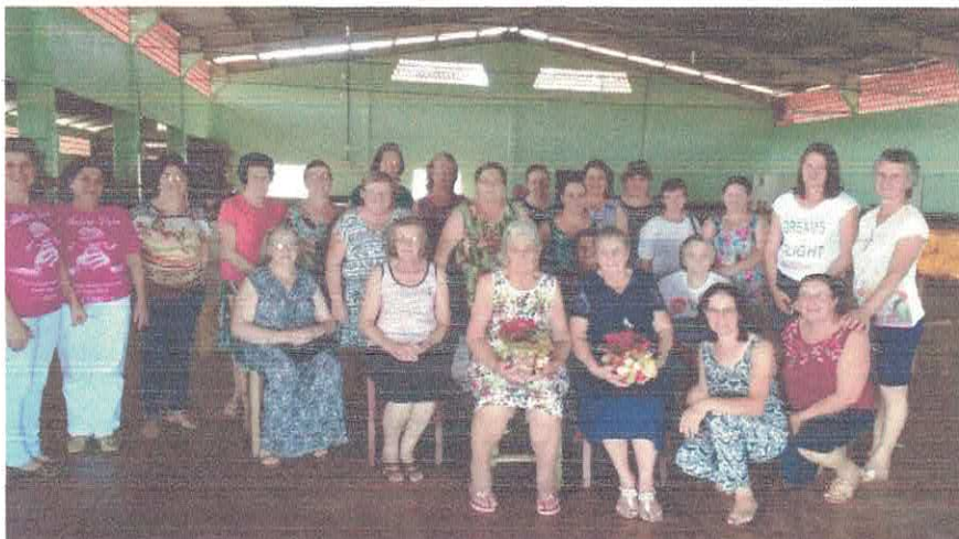
Confraternização das nossas vitoriosas, encerrando o ano de 2017.

Sempre nos orgulha mantermos este laço em campanhas tão importantes..Temos em nosso município casos crescentes de mulheres com câncer e quanto mais informadas mais chances de prevenir ou curar precocemente.