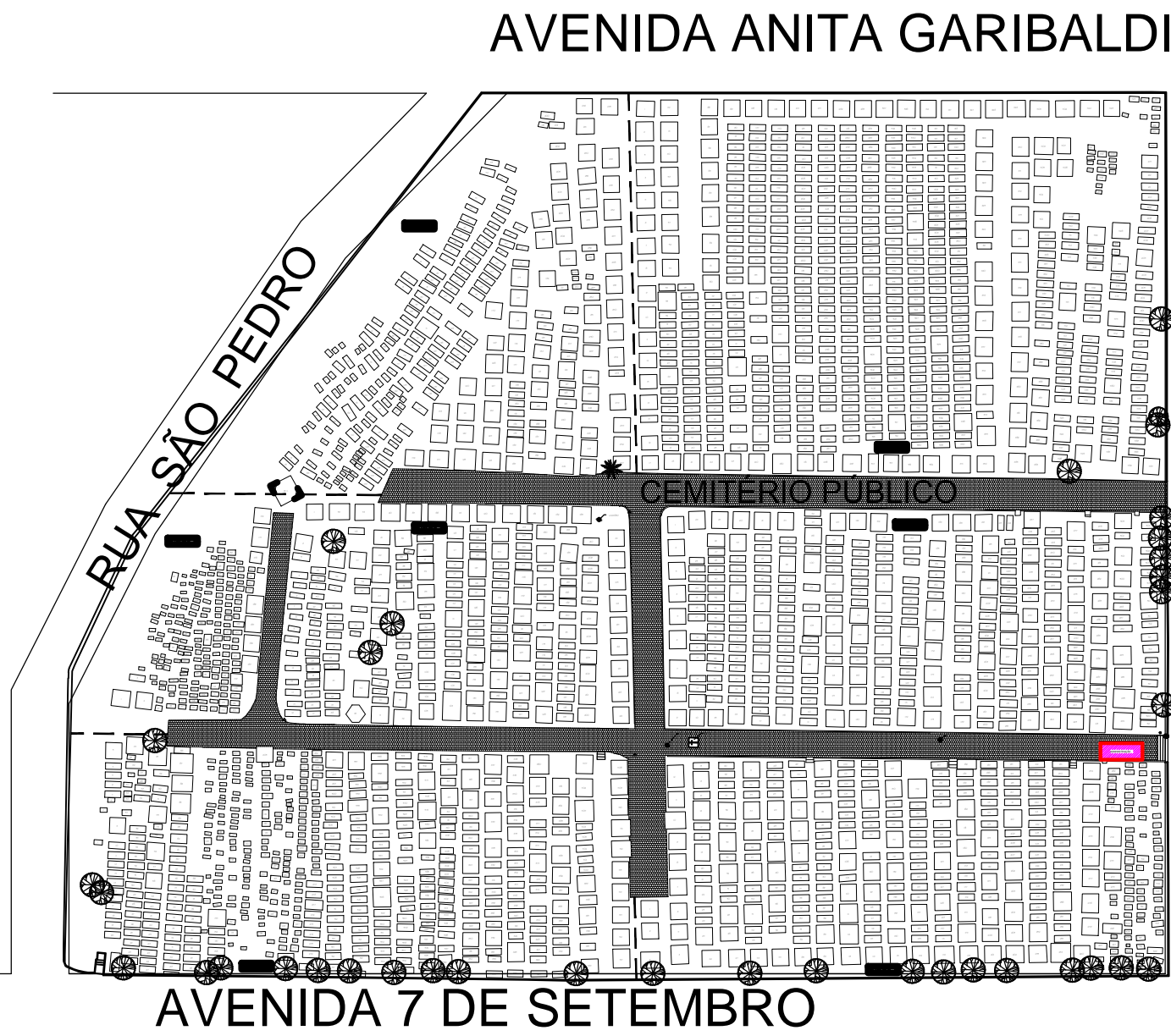
PLANTA DE SITUAÇÃO ESCALA 1:1000